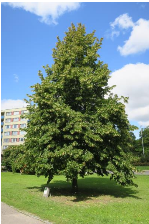
Lípa 17. listopadu s označením

Právě stabilní označení a všeobecná informovanost je nejlepší ochranou před poškozením nebo zbytečným odstraněním historicky důležitého stromu.